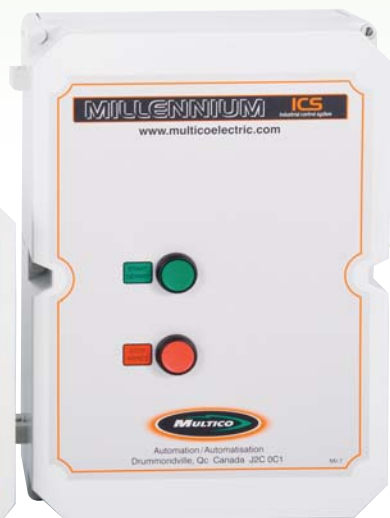
VERSION UL (NEMA 4X)